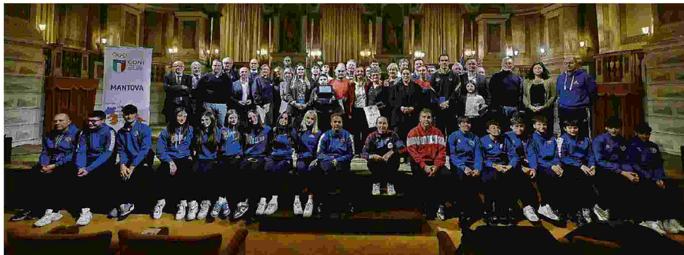
Foto di gruppo per tutti i premiati e le autorità presenti al Teatro Bibiena