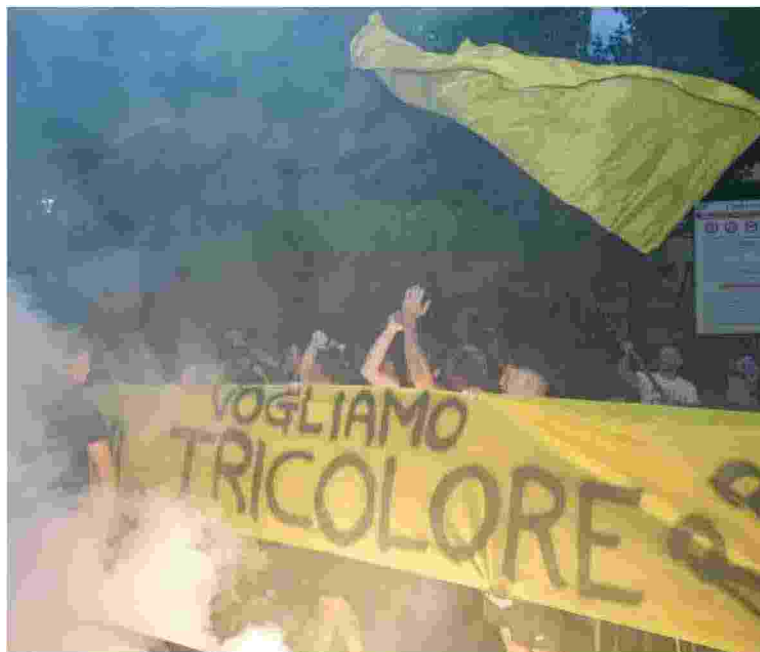
Tifosi gialloneri scatenati ieri ai giardini di Viadana. Cori d'incanto e tanta fiducia

stra forza deve arrivare anche dai nostri giovani. In futuro l'obiettivo deve essere quello di avere una prima squadra con tanti viadanesi.